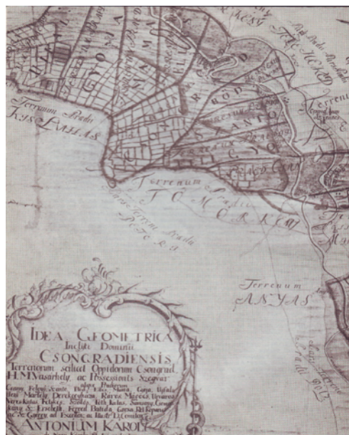
Csongrád és környéke térkép

Visszatekinteni a múltba, kutatni, keresni, bejárni őseink életútját izgalmas, felemelő érzés.