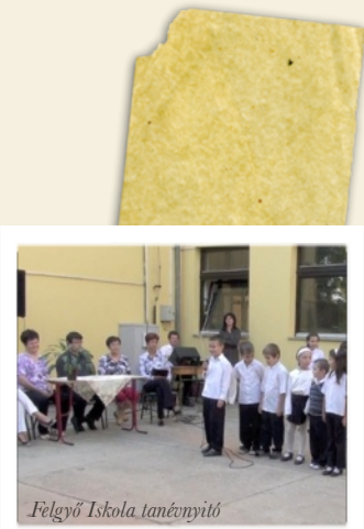
Felgyő Iskola tanérműtő

Iskolánk tantestülete azon dolgozik, hogy helyben mindazon lehetőséget biztosítsuk gyermekeink számára, amelyet egy nagyobb városi iskola nyújthat. Az hogy ez sikeresnek mondható, ezt iskolánk tanulólétszámának növekedése bizonyítja.