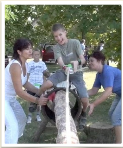
Ezúton is köszönet érte.

Legyen-e falunap az idén? Sokszor felmerült ez a kérdés az utóbbi időkben. A lelkesedésünk és ötleteink megvoltak, csak a szűkös anyagi keretünk szabott ennek határt. Végül is arra az elhatározásra jutottunk, hogy szükség van kis közösségünknek az összefogásra, a közös szórakozásra, a hasznos időtöltésre. Kreativitásunkat az is bizonyítja, hogy az eredetileg eldöntött egynapos falunapból három napos rendezvénysorozat kerekedett. A programok összeállításánál próbáltuk minden korosztály elképzelését és igényét kielégíteni. Így lehetőség volt sportolásra, kerékpártúrára, táborozós bátorság próbára, a technikai sportokra, játékokra, népi hagyományaink megismerésére, táncra, szórakozásra, melyet a meghívott előadók, együttesek, baráti társaságok tettek még színesebbé, változatosabbá. A játékokba aktívan bevontuk iskolánk tanulóit és szüleiket, akik összefogásukkal, példás iskolabarát támogatásukkal hihetetlen sokat segítettek a kitűzött célok megvalósításában.